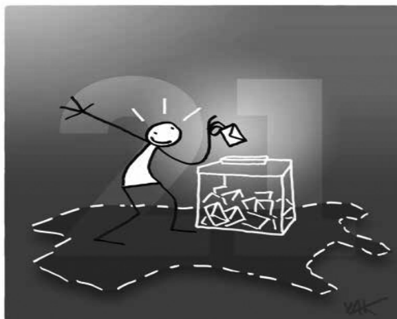
Slika 2. Izorno pravo. 54